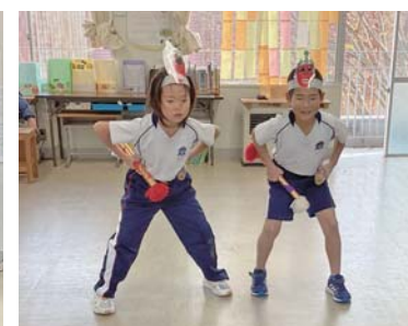
▲3年生の発表の様子

2年生は中条地区の働く人に焦点を当て、探検した内容を発表しました。3年生は蓮華会舞の発表だけでなく、舞の稽古もして、披露しました。4年生は、八尾川を調査し、隠岐にしか生息しない生き物など、分かったことを劇やクイズなどで発表しました。5年生は、田植えや稲刈りの体験、農業を営む方へのインタビューを通して、「食」を支える産業の素晴らしさを伝えました。 会場には、保護者や地域の皆様が来場し、地域の「ひと・もの・こと」と出会う経験の発表に聞き入っていました。