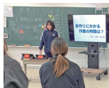
▲5年生の発表の様子