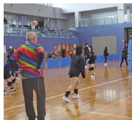
▲柳本晶一氏による バレーボール教室の様子

オリンピックメダリストなどを講師に招いたスポーツ教室が、総合体育館と屋内温水プールで12月6日（土）に行われました。 このスポーツ教室は、競技力の向上やスポーツを通じた健康づくりを目的として開催されており、今回で4回目となります。