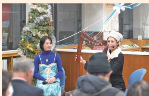
▲民謡ユニット「エイロ」による演奏の様子

12月6日（土）に「よるとしよ」を開催しました。約200名が来館し、町内のお店のドリンクを楽しみながら、民謡ユニット「エイロ」のお二人によるハープと民謡の演奏に聞き入っていました。また、クリスマスソングを皆で歌ったり、楽器に触らせてもらったりするなど、賑やかで楽しい時間となりました。