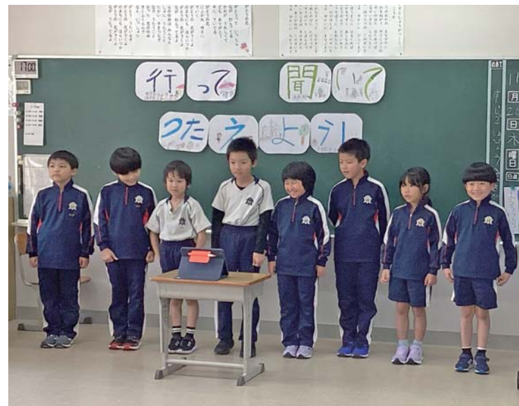
▲2年生の発表の様子

中条小学校は、毎年11月に「すじっこ発表会」と題し、2年生から5年生までが、地域資源等について調べた学習活動の成果発表を行っています。