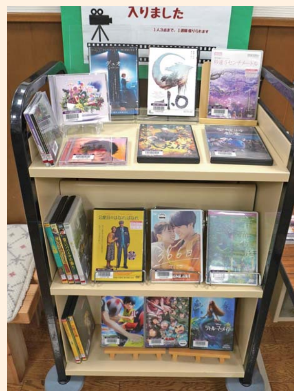
▲新たに入荷したCD・DVD

DVD『ゴジラ-1.0』、『リトル・マーメイド』、『言の葉の庭』、CD『10』（Mrs.GREEN APPLE）、『The Origin』（INI）など、21点が入りました。是非、ご利用ください。