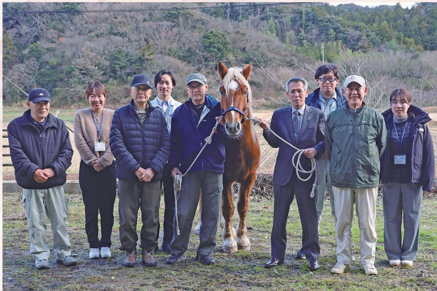
飯田地区の皆様、令和7年度新規採用職員とともに(令和8年1月8日、飯田地区)