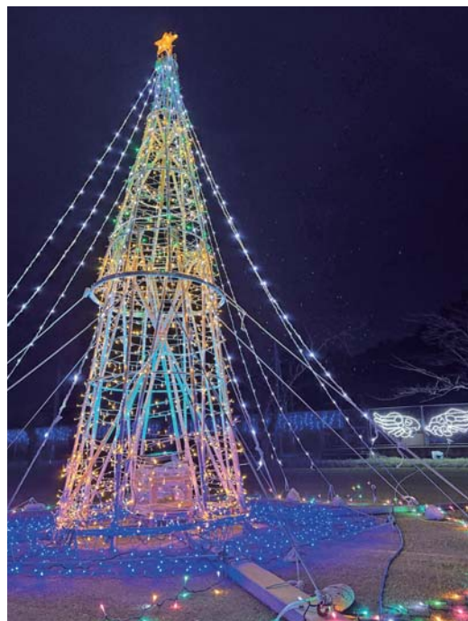
▲クリスマスツリー型の電飾

冬の夜を照らす 布施イルミネーション 第13回布施イルミネーションが、布施町民運動場で、12月13日（土）から1月10日（土）にかけて、開催されました。 会場には、恒例のハート形やクリスマスツリー形の電飾、竹細工で制作されたモニュメントが設置されるなど、多数のLEDライトにより、布施の夜が彩られました。