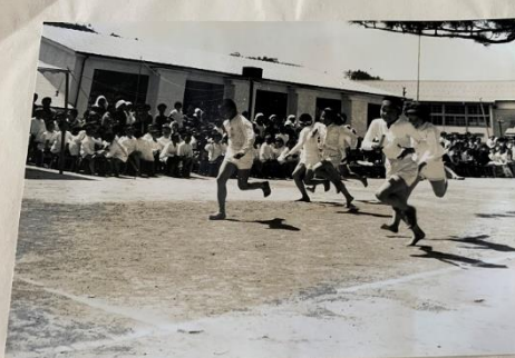
6ねんせいのリレー バトンのつなぐがじつにうまい