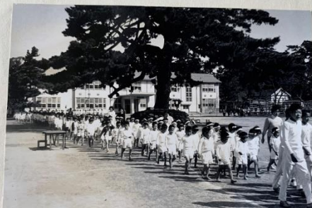
ちゅうかくせいのまじから にゆうじょう

今回は学校に残されていた写真の中から、春の運動会の様子をご紹介します！写真はすべて昭和44年5月1日に開催された保育園、小学校、中学校合同の春の運動会の様子です。当時を知る人は、ぜひご家族で思い出話を花を咲かせてみてください！