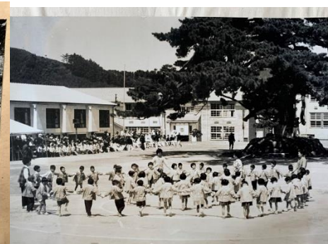
ほいくしまのおどり