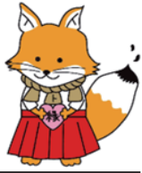
松江地方務局の 不動産登記推進 キャラクター 「緑結びトウキツネ」