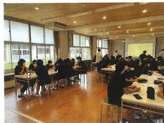
(西郷中学校) 将来の隠岐の島にとって港の近くにどんな機能がよいか思案中