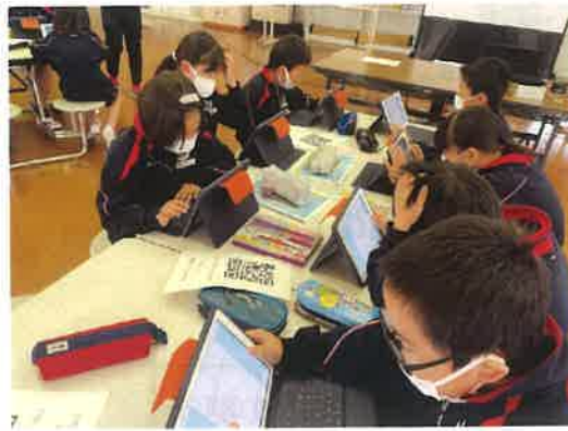
(西郷小学校) 授業の感想をタブレットを使って入力⇒その場で集計されてビックリ!

おとなも、子どもも、タブレットや仮想空間を活用して、まちの拠点に集まれるようWi-Fiやパソコン環境を整備します。(今年度はビューポートの2階に設置します)来年度からはまちなかに整備予定の「まちづくり拠点」に機能を移し、家と学校以外で、友達と勉強したり、話したりできる空間をつくりたい。この拠点では、高校生が中学生に教えたり、小学生に教えたりと、学びのつながり・循環を実現します。