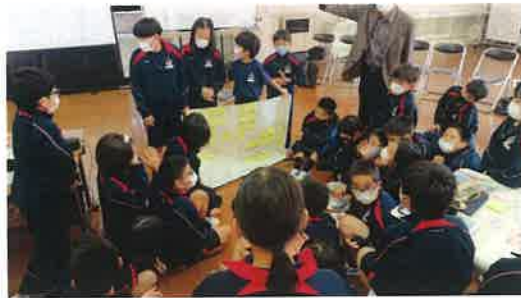
(西郷小学校) 自分達の考えをまとめオンラインで島外のひとへ発表