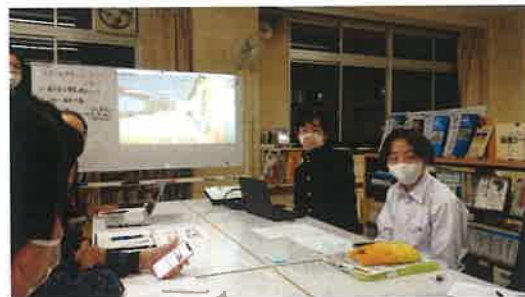
(隠岐高校) 立命館大学の先生に学ぶ仮想空間図書館をメタバースで再現しました