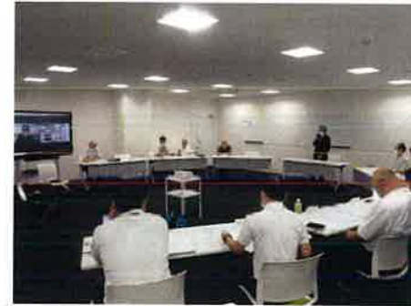
アイノマ協議会のようす

役場内の連携や調整を行う「町内連絡会」で全体を通して総合的な判断を行っています。