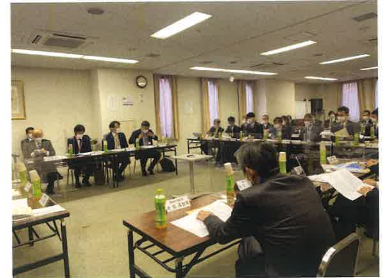
全国から選ばれた12都市の首長による意見交換の様子

隠岐の島町は、離島では唯一の自治体として参加し、全国の進んだまちづくりについて学ぶ貴重な機会となりました。