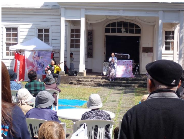
4月 郷土館桜吹雪コンサート