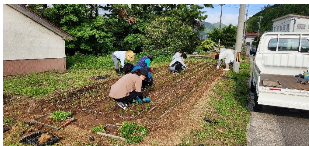
6月 マリーゴールド植え付け