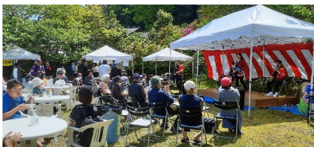
5月 しゃくなげ祭り