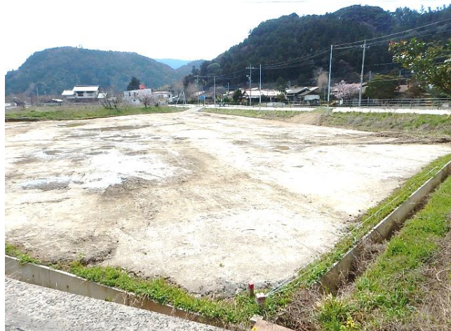
「敷地造成(第1期)工事」による地盤改良後の敷地の様子。 今年度中に敷地に盛土等を行う造成工事と建物の杭工事を 実施予定。

令和4年4月から設計業務などを開始した「中出張所等複合新庁舎整備事業」は、庁舎設計と敷地造成工事の一部が完了したところです。今号では、事業の進捗状況の詳細や、今後のスケジュール等についてお知らせします。