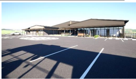
外観建物右手から