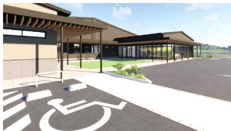
外観建物左手から