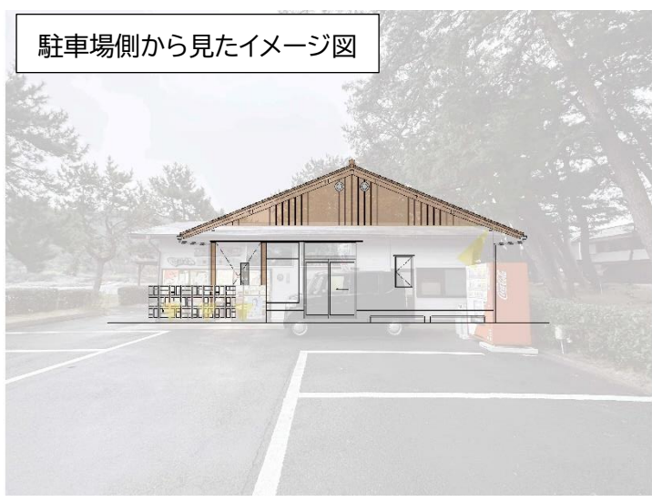
駐車場側から見たイメージ図