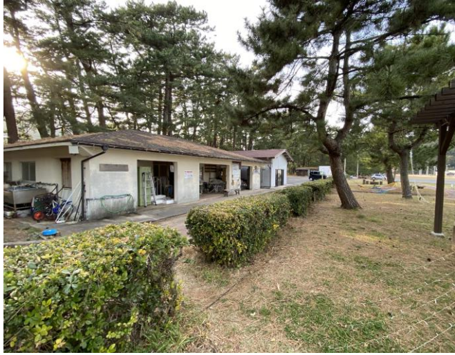
改築工事を予定している中村海水浴場管理棟及び中村特産センター(さざえ村)