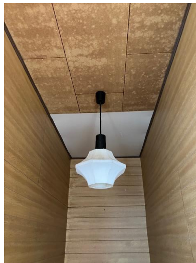
階段上（雨漏れ補修跡あり）