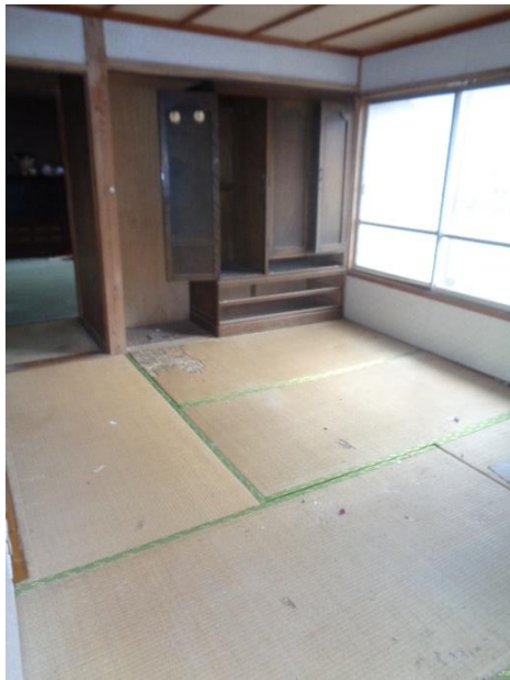
1階 4.5 畳