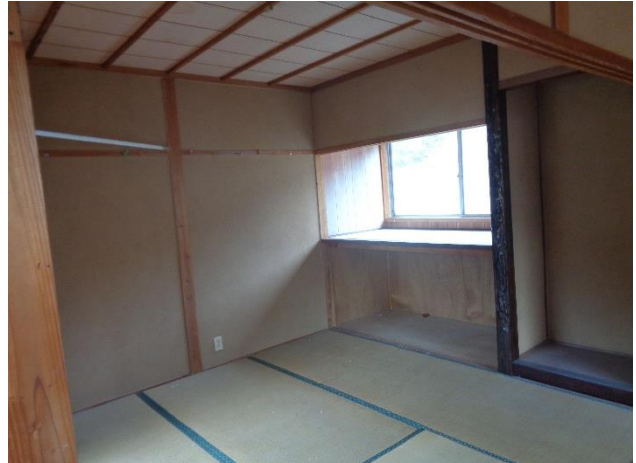
2階 4.5 畳