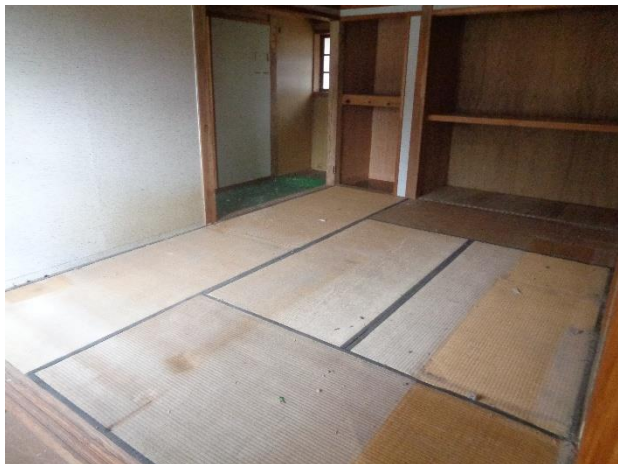
2階 6 畳