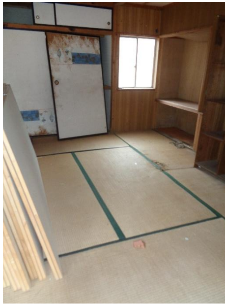
1階 6 畳