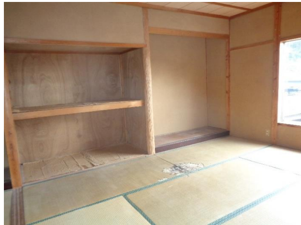
2階 6 畳