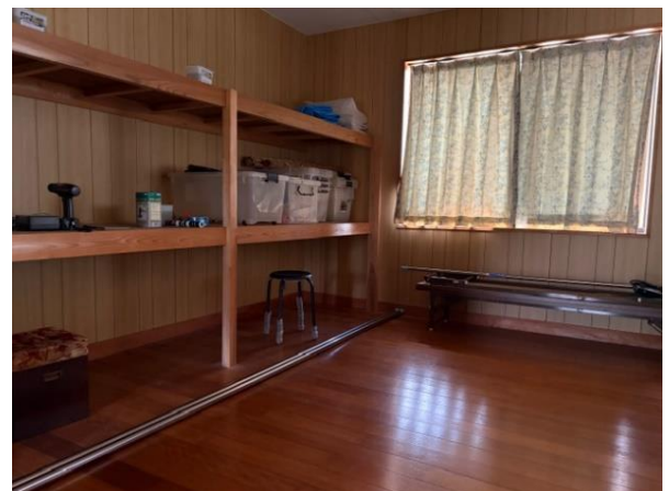
作業室（フローリング）