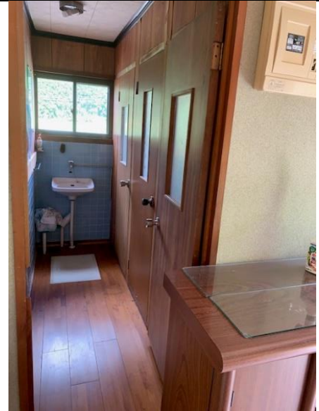
玄関横のトイレ前