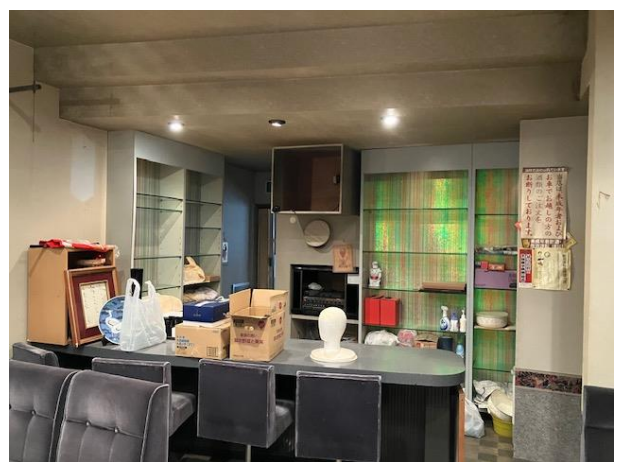
店舗 カウンター部分