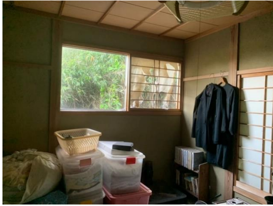
4.5畳のフローリング