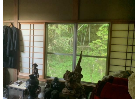
4.5畳のフローリング