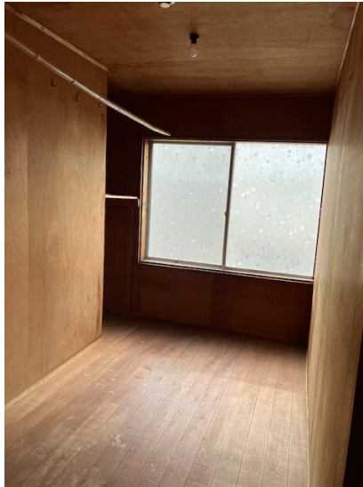
2階洋室 (物入) 3畳