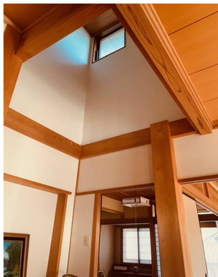
吹抜のある玄関ホールと大黒柱