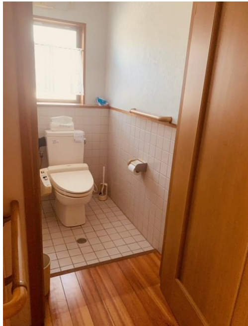
車椅子も可能な！広いトイレ