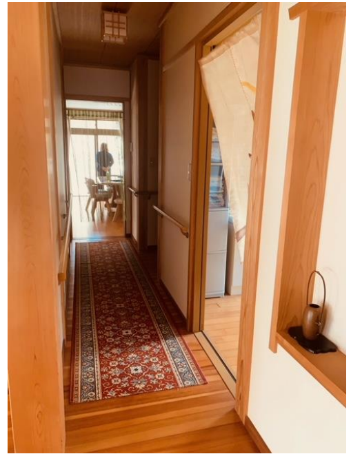
両サイドに手すり付の廊下