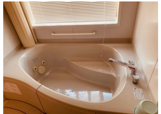
ジェットバス付の浴槽