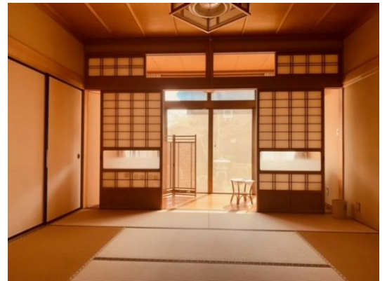
キッチン隣の 和室と洋室