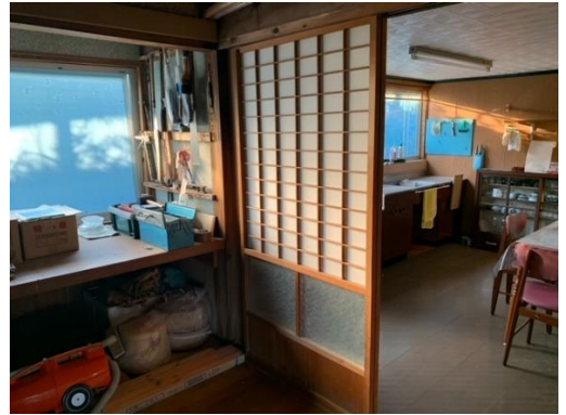
洋室 4 畳