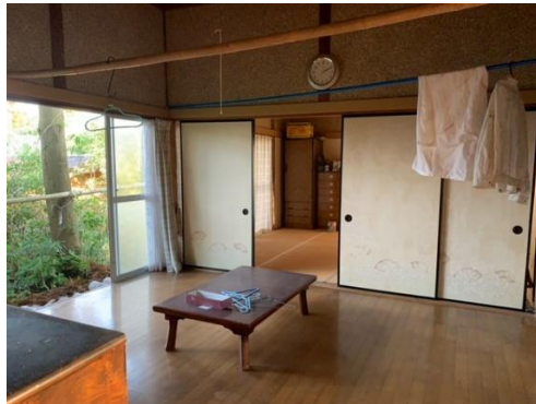
洋室 8 畳