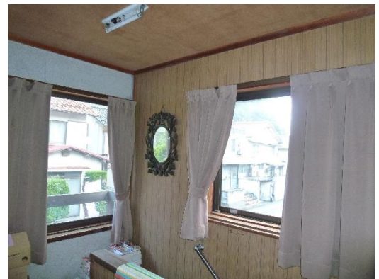
2 階階段躍場（道路側）