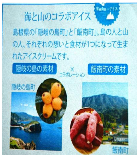
頓原コラボアイス