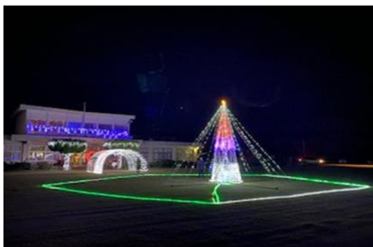
布施公民館イルミネーション