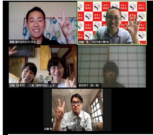
起業支援セミナー