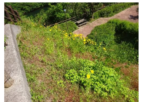
オオキンケイギクの花 (花は 5 月～7 月に咲きます。高さ 10cm～1m くらい)