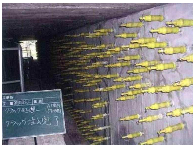
写真3 : ひび割れ注入状況

ひび割れ部分にエポキシ樹脂材、ポリマーセメントなどの補修材料を深部まで注入し、ひび割れ部を塞ぐ工法です。ひび割れを塞ぐことにより、劣化因子（水分、塩化物など）の侵入を防止し、コンクリートの耐久性を向上することができます。