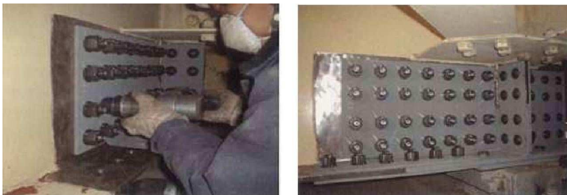
写真1 : 当て板工実施状況

激しい腐食による鋼部材の減厚が生じた箇所に対し、腐食箇所を取り囲むように当て板(添接版)を施すことにより鋼部材を補修する工法です。