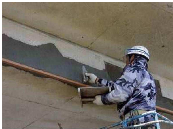
写真2 : 断面修復状況