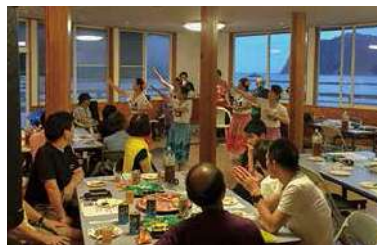
パーティーやミーティング