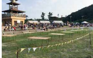
ライブなど、各種イベント