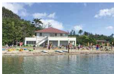
海の体験（個人から団体まで）