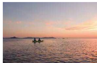
シーカヤック（湾内・湾外）