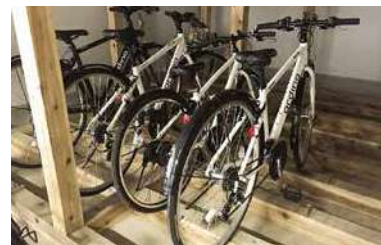
レンタル自転車（集落散歩）