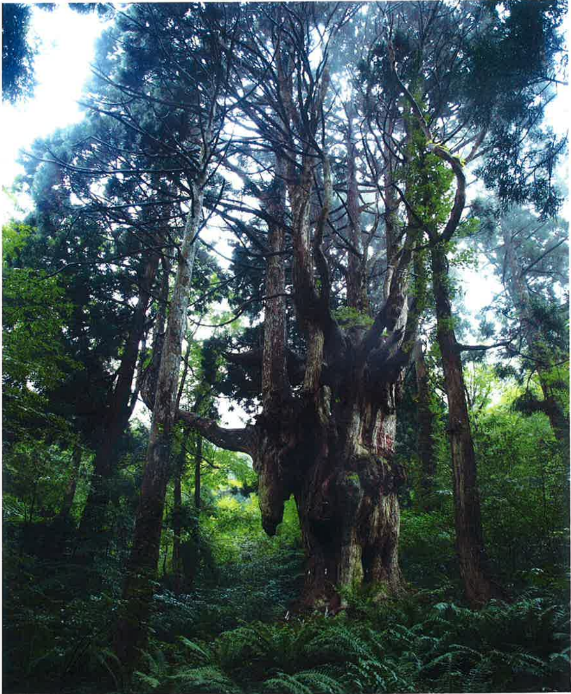
巖かな佇まいの乳房杉・布施