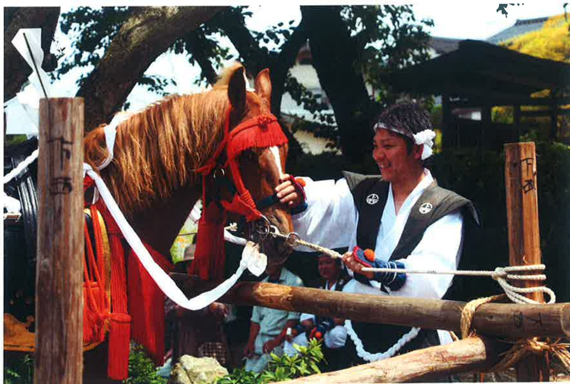
玉若酢命神社御霊会風流