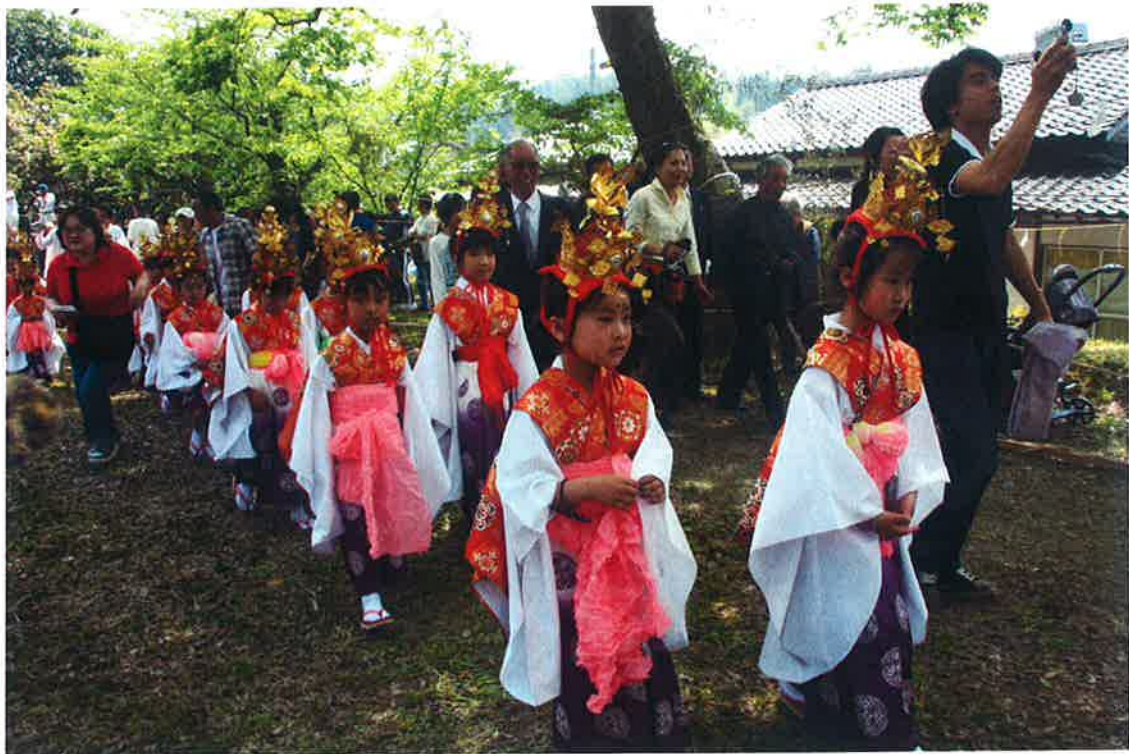
水若酢神社祭礼風流の稚児行列