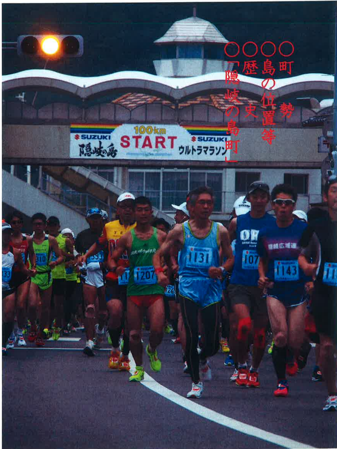
ウルトラマラソン 100キロスタート地点