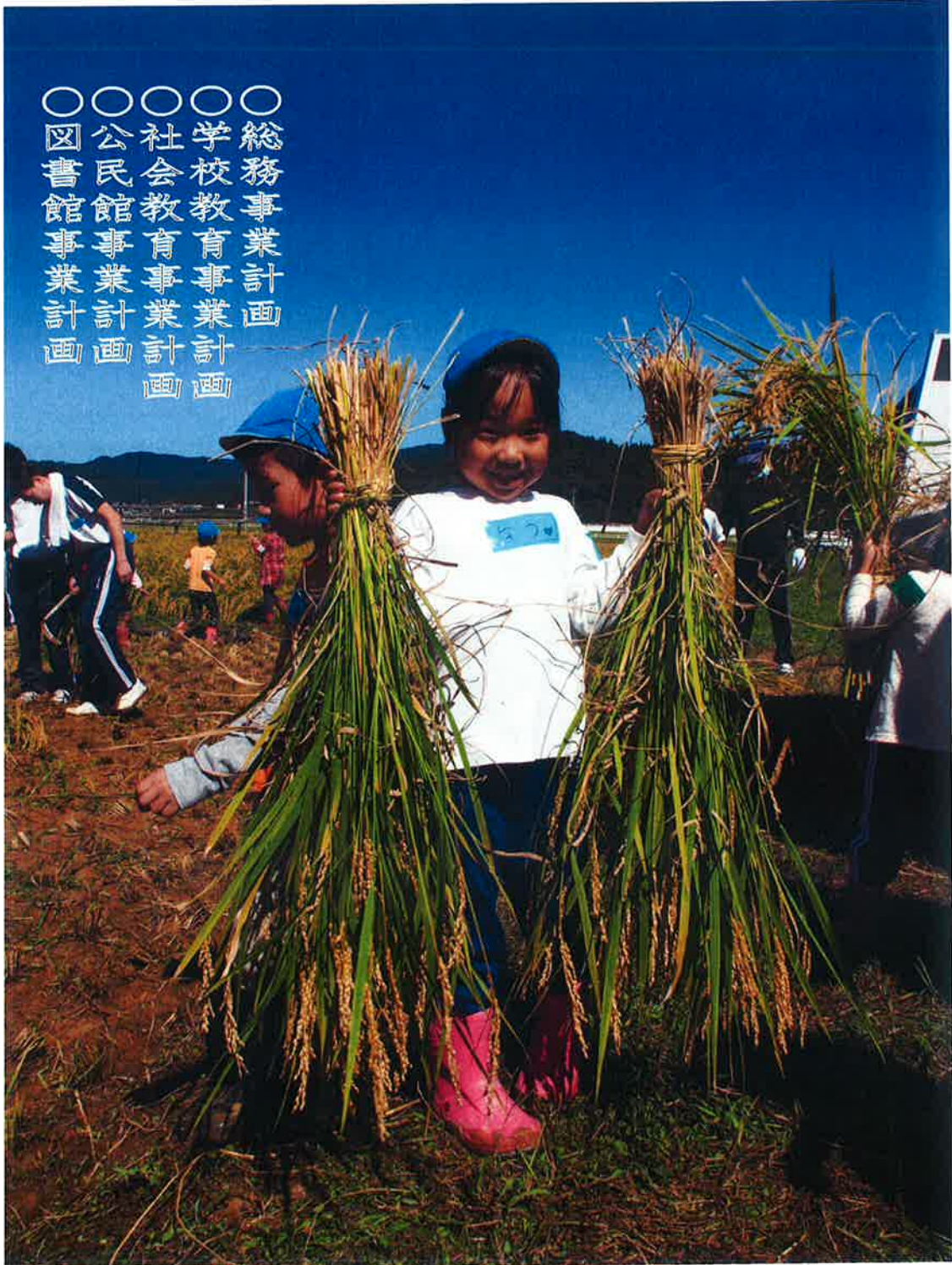
収穫終えてハイポーズ