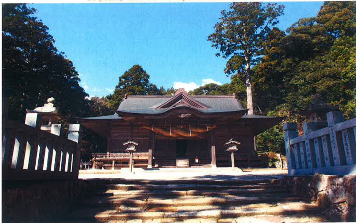
由緒ある玉若酢命神社・拝殿