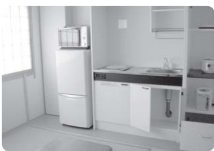
レインボープラザの長期滞在室

条例改正でレインボーホテルの妊婦や患者の利便性を計る。補正予算では4453万円を増額、介護保険事業の十八年度繰越金の確定により、基金の積立金を1206万円増額、町負担を382万円減額。全議案とも原案どおり可決した。