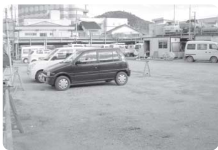
新たに出来た駐車場

Q 質問 今回の災害では過疎化や高齢化率の高い地域の被災が大きい。現状復旧では再び災害が起らないか、住民は不安である。定住を促進する為にも災害関連事業等の導入も考えるべきと思うが。 A 回答 災害関連事業、治山事業等地域の実状、住民の声も聞きながら総合的に復旧していきたい。