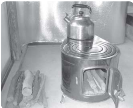
ブリキ製の薪ストーブ

議員 飛行場跡地に自衛隊の学校を誘致してどうか。自衛隊の機動力があれば災害有事の際でも大きな力となる。島の経済的メリットも含め誘致の是非を町民レベルで議論してはど