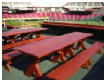
新しい技術に挑戦。

◆新エネルギー事業費 1000万円 木質バイオマスを原料とした、スポーツスタジアム・ベンチなど新技術を開発するための事業費。 ふるさと財団補助金 1000万円