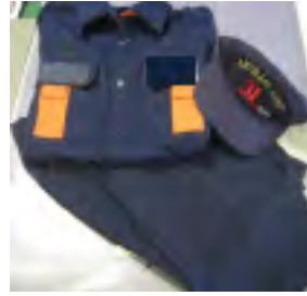
新しい消防団員活動服