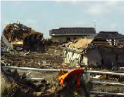
東日本大震災、早期の復旧を願う