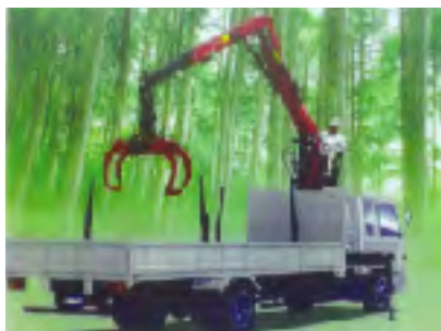
グラップル付トラック