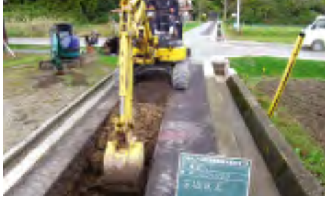
大久地区排水管路工事