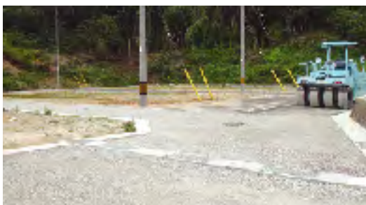
整備が進む旧下西小跡地