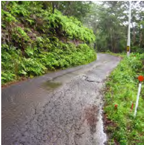
危険な加茂蛸木線道路