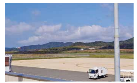
隠岐―出雲便の安定就航を

日本エアコミュニケーションから、昨年この路線は赤字であるという説明があった。しかし、搭乗率は高くなっており、島民にとって欠かすことのできない本路線の運行継続のために、島民の運賃助成とは別に、赤字予測額相当を国2分の1、