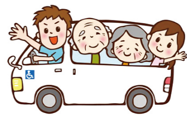
持続可能な介護サービスを!

住民福祉課長 指定管理料との併給を認め、単年度の黒字分を返還させる「精算」は行わない。法人の次期事業への繰越を容認しつつ、長期的な収支は将来の管理料算定に反映させる。