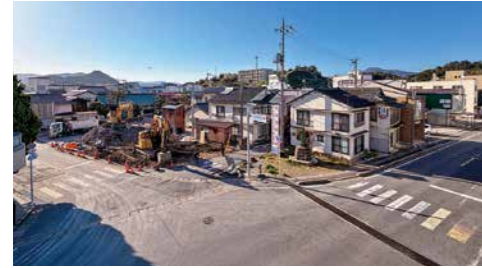
地域住民の声を生かしたまちづくりを!

委員会に付託された案件のうち、議第13号の国保条例の一部改正、議第28号の国保特別会計当初予算は賛成多数で「可決すべし」とし、その他の条例制定・改正・廃止、工事請負変更契約の締結、財産の無償譲渡、令和8年度一般会計及び特別会計当初予算、第2期総合保健福祉計画は、すべて全会一致で「可決すべし」とした。