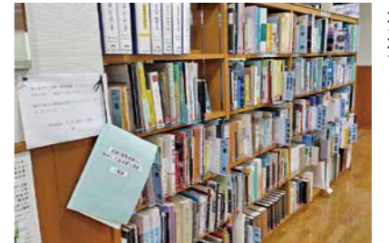
図書館の郷土資料棚

図書管理運営事業 3660万円 委員からは、「前年度に比べ約590万円減額になっているが、図書館は町民の文化活動の中心的役割を担っており、特に郷土資料アーカイブ事業は郷土資料を整理する人件費の削減はするべきではない」との意見があり、担当課からは「指摘を受け止め今後対応を検討する」との回答があった。 委員会としては、大