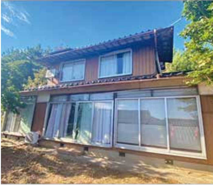
危険空き家になる前の空き家解体にも助成を

質問 我が町には「空き家バンク」に登録していない家屋が多数あり、ほとんどの家屋がみすぼらしい状態である。所有者又は相続人が解体しようと思っても、相当な費用がかかるため、ためらっている状態である。しかし一方では「危険家屋」に認定された場合は、解体費用の助成がある。「危険家屋」になる前に