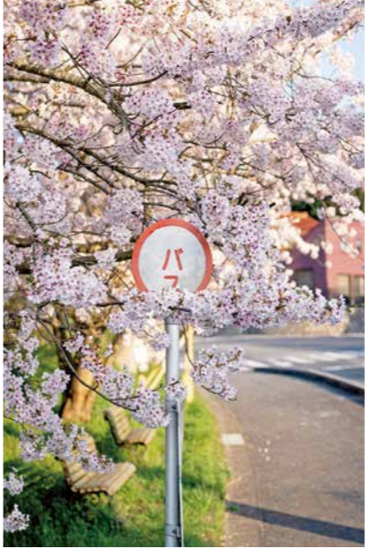
高齢者の交通支援の充実を

質問 先ほどの答弁の中に私と共有する理念があり、具体的に政策としてつなげるべきと考える。 高齢化が進む本町で、