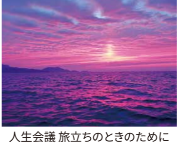
人生会議 旅立ちのときのために

質問 最前線で活躍する方々、職員等のトップとしての思いは。 町長 一つだけ言えるのは「人としてどう寄り添っていかか」。しっかりとやっていきたい。