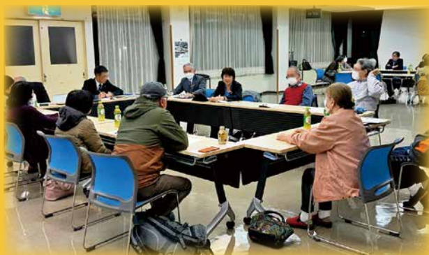
昨年の懇談会の様子