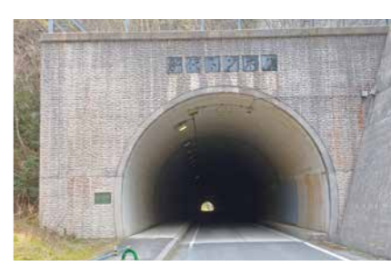
代トンネル改良の早期実現を

建設課長 令和7年度にトンネル出入口部分の拡幅が完了し、令和8年度はトンネル内を行う。その後令和11年度まで順次施工をすすめる。