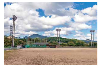
夢を広げる島外遠征

社会教育課長 変更の周知は行う予定であるが、事前説明や各家庭への経済的な影響調査は行っていない。制度変更の理由は財政的な面と、事務手続きの面で見直しを行った。