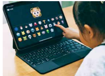
更新される旧端末の再利用を