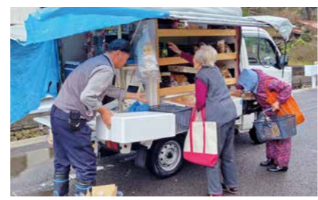
助かっている移動販売