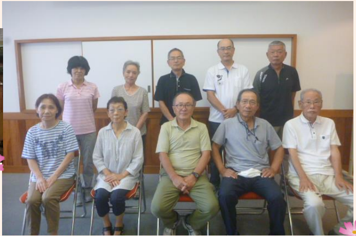
都万地区部会～集合写真