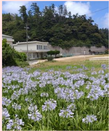
旧布施小学校に咲くアガパンサス