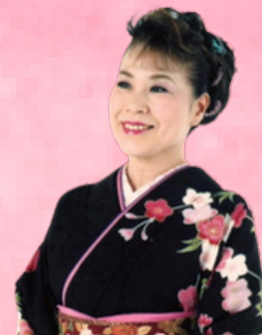
国村千鳥 隠岐の島町民謡観光大使