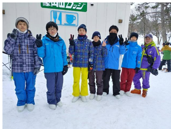
五箇中学校スキー教室