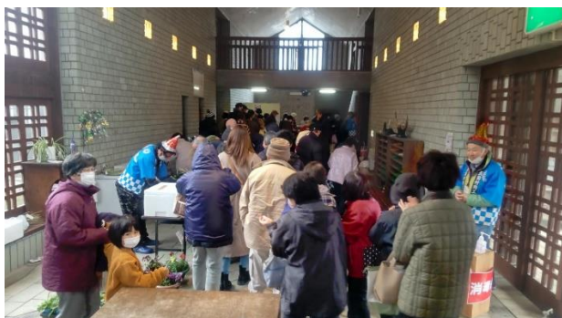
12月 暮のこぞって市