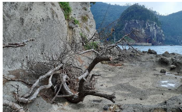
福浦トンネルの倒木