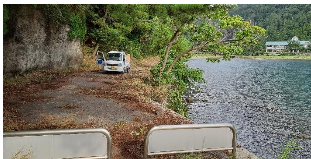
8月 福浦トンネル周辺草刈