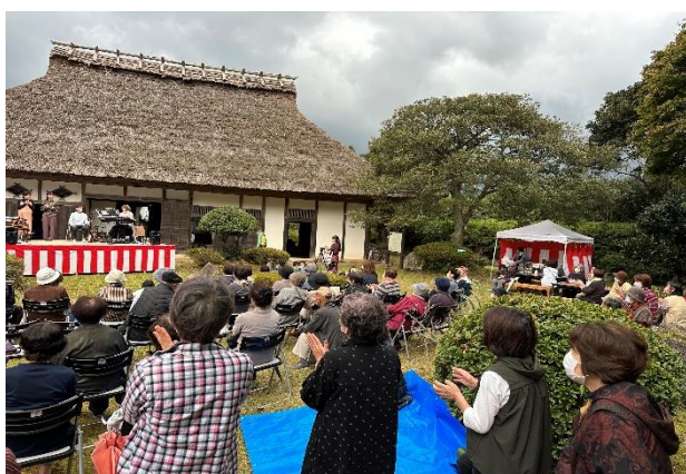
10月 都万目の民家演奏会