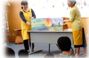
大型絵本『きよだいなきよだいな』