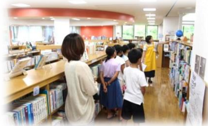
館内案内で本の探し方を説明