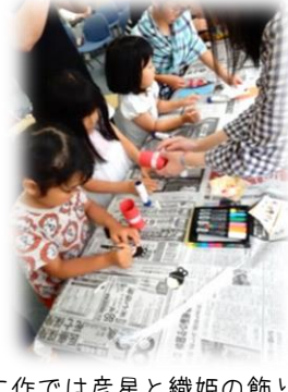
工作では彦星と織姫の飾りを時間いっぱい作りました。