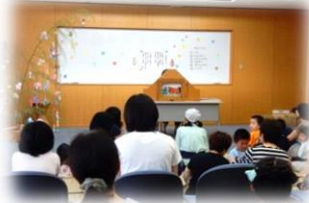
紙芝居『たなばたものがたり』

7月1日(土)にたなばた会を開催しました。 たなばたの由来の書かれた紙芝居や大型絵本を読んだり、手あそびや工作、短冊に願い事を書いたりしました。