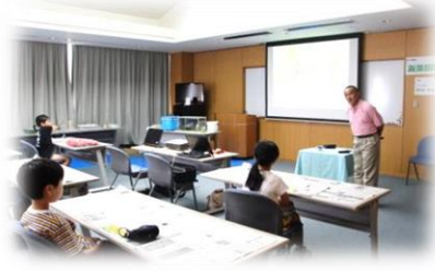
阿部先生より、ジオパークや隠岐の海岸、海藻の種類等のお話。