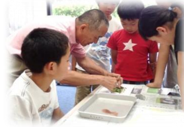
選んだ海藻を撮影しやすいように台紙に広げる作業。みんな真剣です。