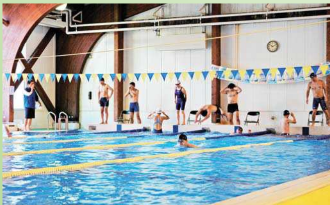
水泳競技会の様子

今大会では105レース中、66種目で新記録が出るなど目を見張るものがありました。