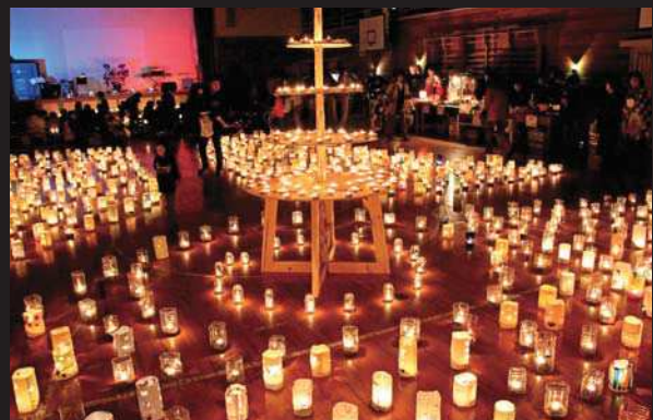
色とりどりのキャンドルが並べられた会場

来場した大勢の方は、優しくゆれる幻想的な灯りの中で、いつもとは違った冬の夜を楽しみました。