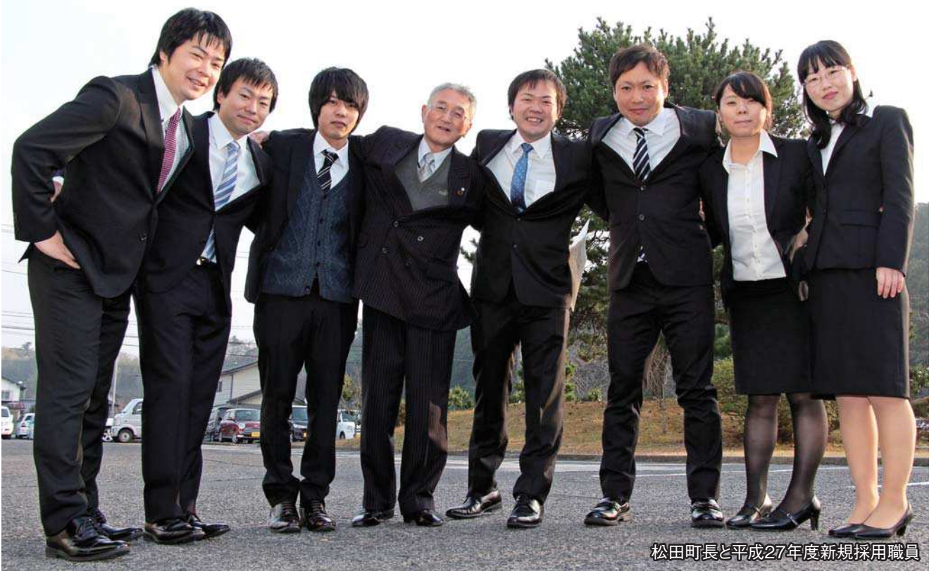
松田町長と平成27年度新規採用職員