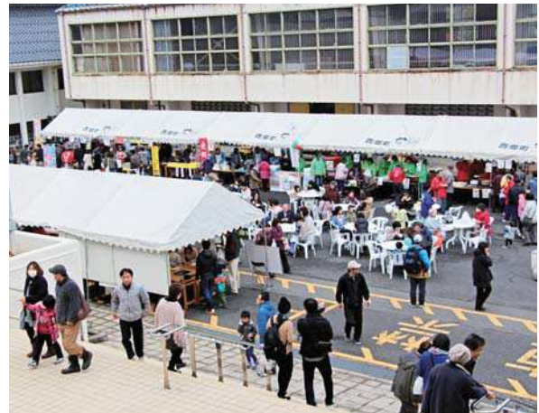
屋台が立ち並び、大勢の来場者でにぎわう会場の様子

寒空の中でのイベントとなりましたが、温かいカニ汁や豚汁などもふるまわれ、会場は、親子連れなど来場した大勢の方でにぎわいました。