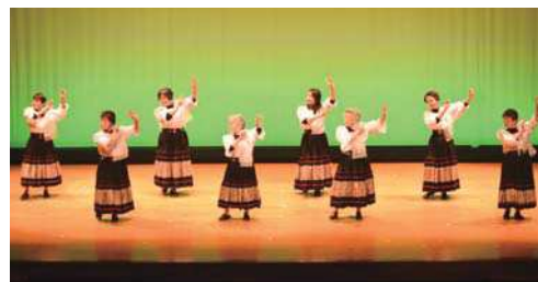
隠岐フォークダンス連盟の皆さんによる踊り

発表会では、6組の団体が、フラダンスやフォークダンス、バンド・吹奏楽の演奏などの様々な演目を披露しました。来場した皆さんは、個性あふれる演目を楽しんでいました。