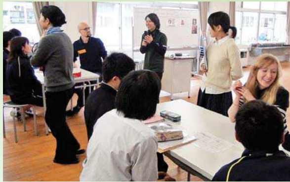
指導力向上授業研究会の様子