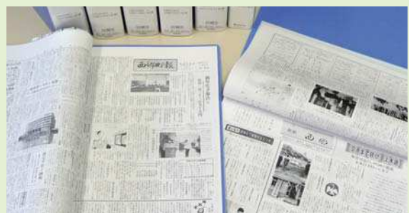
ファイルにとじられた「広報さいごう」の複写

昭和29年～平成16年分の広報さいごうの複写が完了し、図書館での閲覧が可能となりました。ご利用ください。