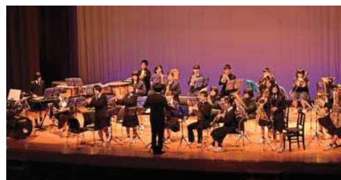
西郷中学校吹奏楽部の皆さんによる演奏