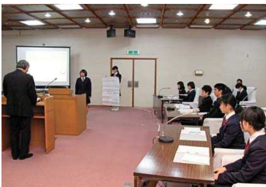
町長の答弁を聞く、中学生議員

中学生議員は、「災害時の備えとして地域ごとに防災リーダーを作る」、「高齢者と若者の交流の場として、地区でバザーなどのイベントを行う」、「買い物へ交通対策として、自家用車を共同利用する」などの提言をしました。