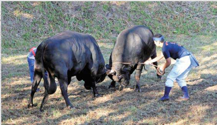
10月13日に行われた一夜嶽牛突き大会の様子

取組の際に綱取りは、牛の鼻に繋がる綱を持ち、常に牛の様子を見ながら綱を操り、絶えず牛へ声をかけます。上手く綱を取るためには、その牛がどのような牛であるのか、