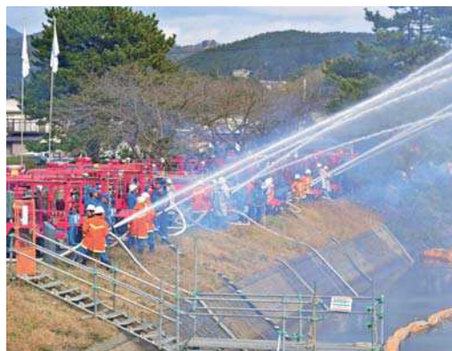
八尾川土手で行われた一斉放水の様子

隠岐の島町消防出初式が開催され、町内消防団など関係者約370名が参加しました。 隠岐の島町総合体育館前での通常点検に続き、隠岐島文化会館で式典が行われ、その後、役場本庁前で、新春恒例の一斉放水が行われました。 消防車輛18台による一斉放水では、見物に訪れた大勢の皆さんを前に、大きなアーチを描いていました。