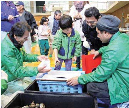
さざえの掴み取りに挑戦する来場者

また、布施公民館では、布施文化祭も同時開催され、作品展示や手作り鉄砲での射的、スタンプラリーなどの催しが行われました。