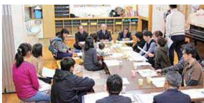
写真上は山田地区、写真下は隠岐若者100人委員会との対話の様子