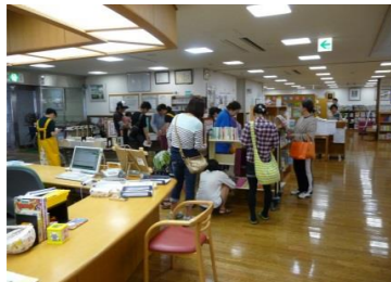
ミニ古本市の様子

6月13日(土)によるとしよの今年度第1回目を開催しました。玄関ホールではミニ古本市、雑誌コーナーでとしよカフェ、そして研修室では隠岐アゴラの会の方の発表「読んで考え想いで語る隠岐アゴラ」がありました。今回もたくさんの方にご来館いただき、盛況でした。