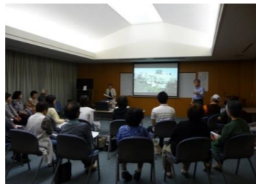
隠岐アゴラの様子