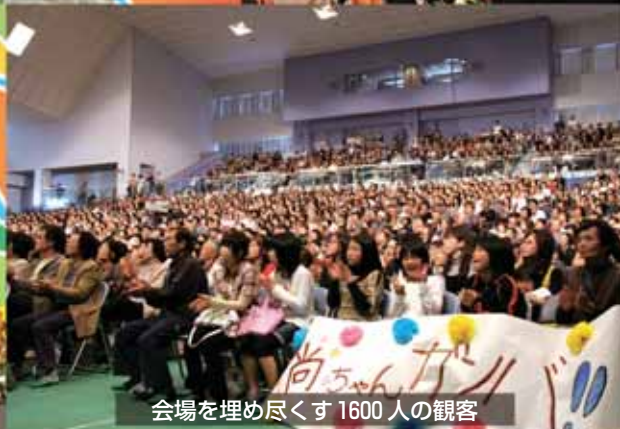
会場を埋め尽くす1600人の観客