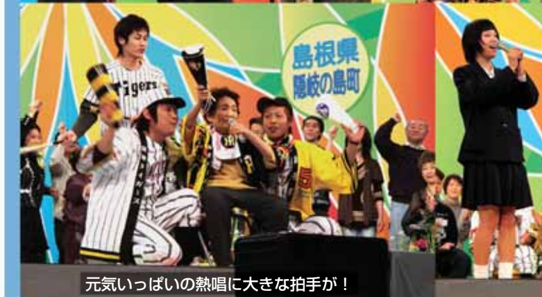
元気いっぱいの熱唱に大きな拍手が！