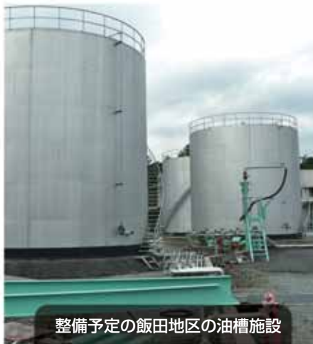
整備予定の飯田地区の油槽施設

昨年6月に発生した混油事故以来、石油備蓄タンクが使用できない状態が続いており、現在タンクローリー車によるフェリー運搬をしています。