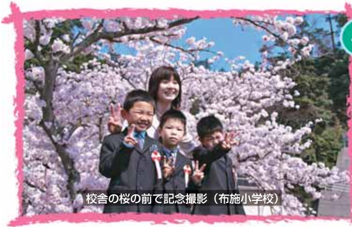
校舎の桜の前で記念撮影（布施小学校）

4月9日と10日、町内の小中学校で、入学式が行われました。中でも、大久小学校、飯田小学校、中村小中学校、布施小中学校では、来年春の統廃合を控え、最後の入学式となり、感慨もひとしおでした。