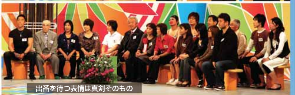
出番を待つ表情は真剣そのもの