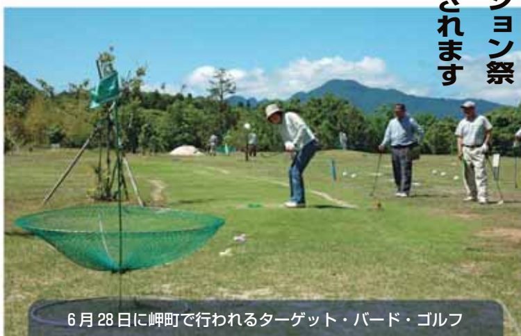
6月28日に岬町で行われるターゲット・バード・ゴルフ

隠岐の島町では、6月28日に岬ターゲットバードゴルフ場においてターゲットバードゴルフ大会を行います。西郷湾口を行き交う船を望むことができる県内でも人気のコースで、とても気持ちよい大会になりそうです。みなさんもこの機会にぜひ大会に参加し、健康づくりやスポーツに親しむきっかけづくりに取り組んでみませんか。