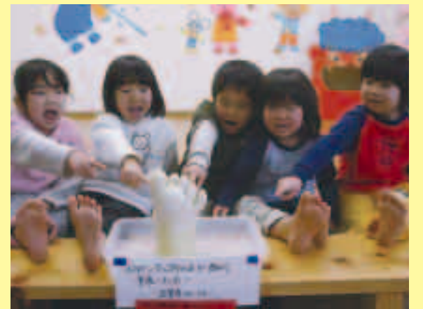
●周囲は33cmあり、まさに「大根足」

「ねがほんどの」大根足！ 中村保育園より 中村保育園に突如現れた不思議な大根。先端には5本の指が！まるで足の先とくくりの形をしています。 この大根、実は近所の方が1月31日に畑で収穫され、「とてもめずらしい形なので、是非子供たちに見てもらいたい」と保育園に寄贈されたものです。 子供たちも最初は不思議そうに覗き込んでいましたが、めずらしい「プレゼント」に大喜び！みんなの足と大きさをくらべてです。