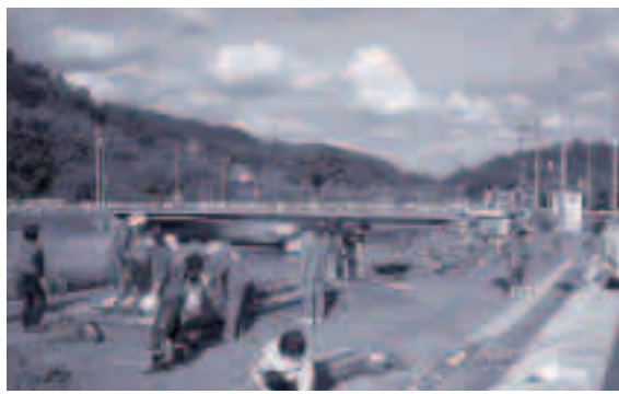
●スマレサークルがハボタンを植樹

島根県道路愛護ボランティア制度の「ハートフルロードしまね」に武良地内から3団体（スマレサークル、空き地に花を植えよう会、伊後区）が認定されました。この制度は、県管理の国道・県道において地域住民のボランティアにより、道路の清掃や花壇の管理、植樹などの美化活動を行う団体を認定しています。