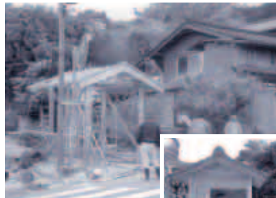
●西村地区バス停建築工事の様子と完成したバス停