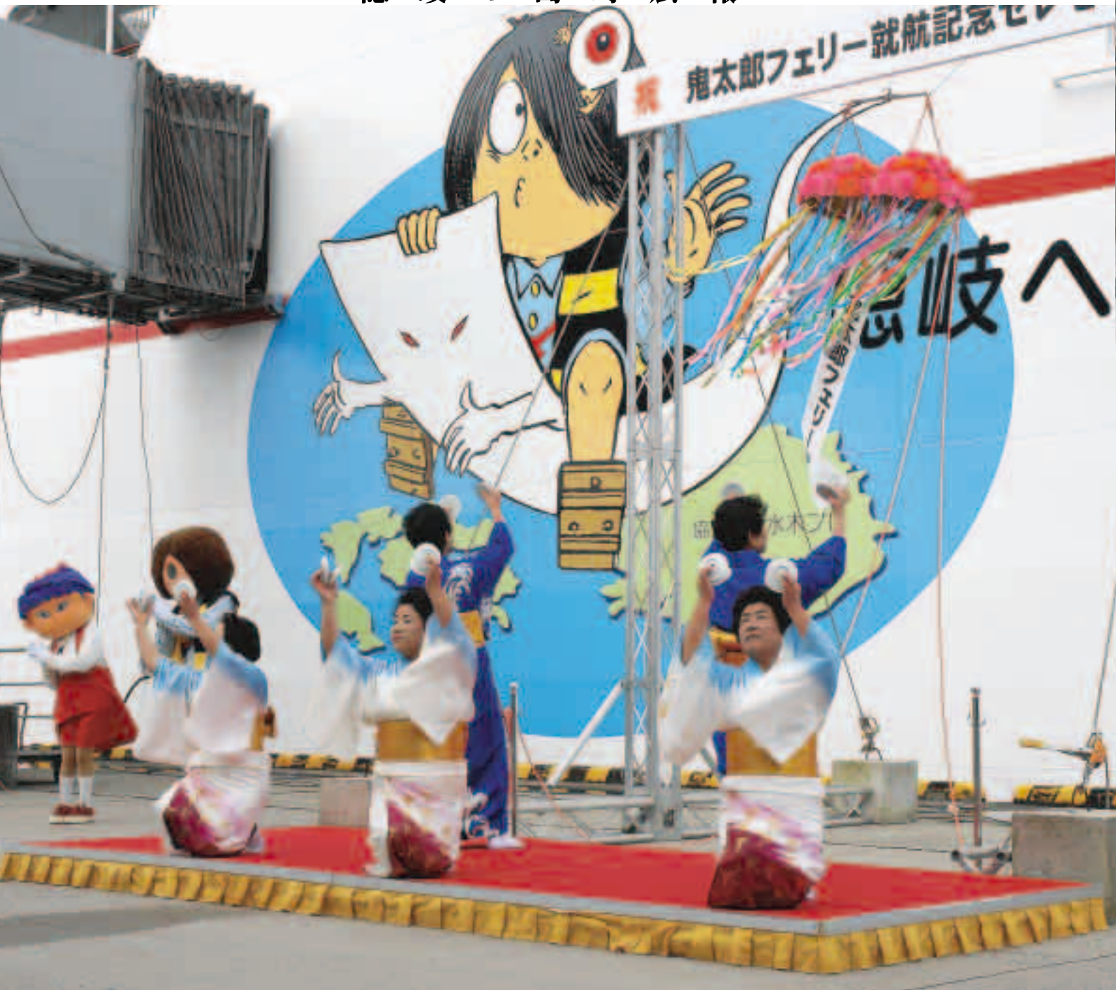
鬼太郎フェリー就航記念セレモニー