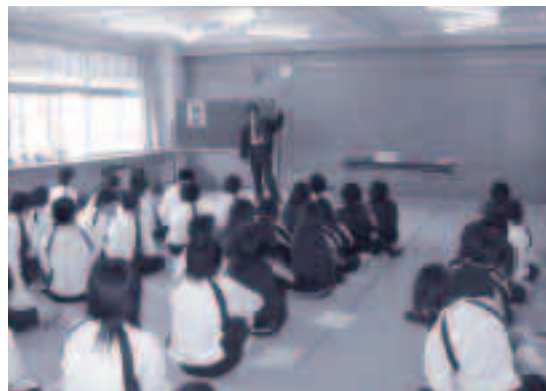
●西郷南中学校(5/20実施)