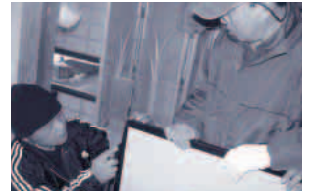
●年末の「住宅補修ボランティア事業」は歳末たすけあい募金を活用して実施されました。