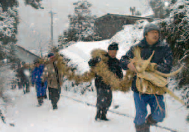
●自然に感謝し、豊作を祈ります

「ねがほんどの」大根足！ 中村保育園より 中村保育園に突如現れた不思議な大根。先端には5本の指が！まるで足の先とくくりの形をしています。 この大根、実は近所の方が1月31日に畑で収穫され、「とてもめずらしい形なので、是非子供たちに見てもらいたい」と保育園に寄贈されたものです。 子供たちも最初は不思議そうに覗き込んでいましたが、めずらしい「プレゼント」に大喜び！みんなの足と大きさをくらべてです。