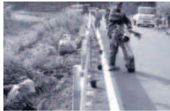
●空き地に花を植えよう会が紫陽花を植樹

今年度は、伊後地内から中村までの約3キロ区間の美化活動を行いました。3月には各団体の想いの入った花のデザイン標識が道路沿いに設置されます。 武良道路も完成間近となり、ハートフルによる道路への愛着心が深められれば、快適な道路環境が創出されます。武良を訪れた人が、心がなごむような地域になることを期待しています。