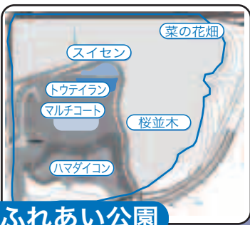
空港ふれあい公園

眼下に広がる紺碧の海と四季を通じて咲き誇る花木の景観を満喫できるスケールの大きな公園です。また、水平線から昇る朝日やしずむ夕日の眺望は最高です。ぜひご利用ください。