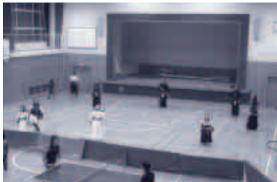
●稽古風景、朝早くから一所懸命です。

今年、総勢121名が参加し、柔道・剣道・ジョギング・スポンジテニス・卓球・サッカーの6種目に汗を流しました。 稽古は朝6時30分から7時30分まで、稽古が終わったら、一緒に朝食を食べます。 今年39回、来年には第40回という節目の年です。五箇地区民のみならず、他の地区からも多くの参加者が集まるといいですね。