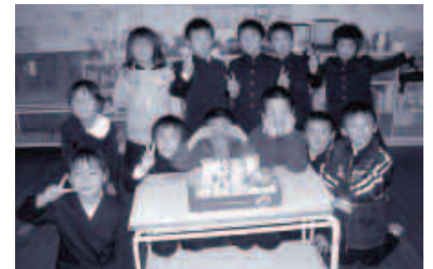
●五箇小学校2年生の皆さん