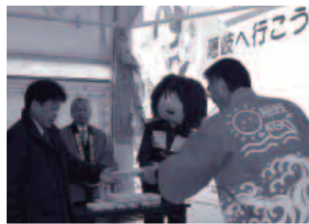
●初出航は紅白まんじゅうでお祝いしました

く船内の売店も「妖怪風」に改修されています。セレモニー後は一足早く船内が公開され、訪れた人は珍しそうに船内を見学していました。 翌日の1月20日（金）には、西郷港から鬼太郎フェリーの初出航となる島前経由境港行きの便が出航し、乗客全員に紅白まんじゅうが配られて就航を記念しました。