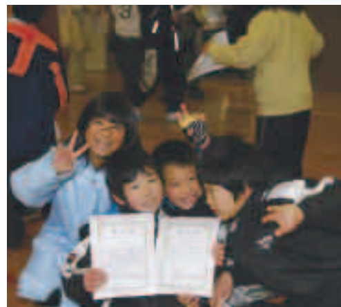
●終了証をもらってニッコリ！

1月22日(日)、都万目で荒神さんを祀る行事が行われました。荒神さんは、山や農業の神としてまた地域神として崇敬されているものです。 雪となったこの日の朝、地区の人たちが総出で、持ち寄った藁を編み荒神さんにお供えする大蛇を作りました。 長さ10メートル近くもある大蛇が出来上がると、集会所の広間に運び、とぐろを巻かせ、お神酒、ご馳走と一緒に供えます。その後、近くの山の中腹にある荒神社に運び、樺(ケヤキ)の木に巻きつけお供えし、今年一年の安全や豊作をお祈りしました。