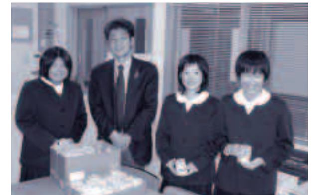
●飯田小学校6年生の皆さん