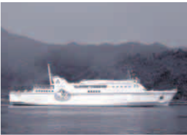
●縦8m、横10mの大きな絵は遠くからでもよく見えます

1月19日（木）、境港市の隠岐汽船フェリー乗り場で、「鬼太郎フェリー」の就航記念セレモニーが開催されました。鬼太郎フェリーは、島前を経由して境港に発着するフェリーしらすの船体に、「ゲゲゲの鬼太郎」に登場する「鬼太郎」「目玉のおやじ」「一反木綿」を縦8m、横10mの大ききで描いたもので、島前・島後の島影をバックに鬼太郎が「隠岐へ行こう！」と呼びかけるというデザインになっています。全国的に有名な「水木しげるロード」を海