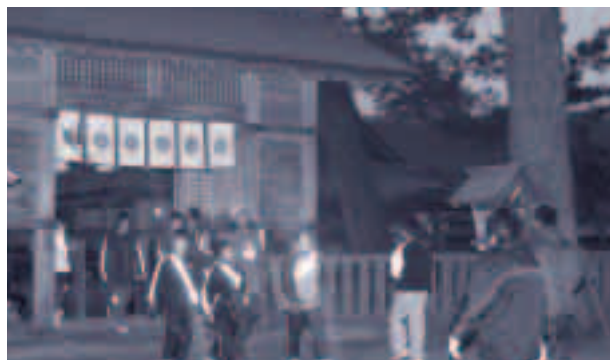
●初日のジョギング、一年の健康を水若酢で祈ります

1月29日から2月4日までの1週間、毎年恒例の五箇地区冬期体力づくり教室が、五箇町民体育館を中心会場として開催されました。今年も「健康なカラダと元気なあいさつ」を目標に1週間がんばりました。 冬季体力づくり教室「寒稽古」は、1年間の健康を願い、強靱な精神と体力増進への意欲と態度を養うために、毎年大寒のときに行います。