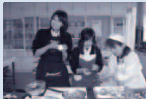
●しっかり食べてがんばってください

現に自衛官である者については、22歳以上28歳未満の者 試験期日 第1次試験 ・筆記試験 5月20日(土) ・操縦適正検査 5月21日(日)(飛行要員希望者) 第2次試験 6月20日~22日のいずれか1日 試験場所 第1次試験 松江・浜田会場 (飛行要員の操縦適正検査は松江会場) 第2次試験会場 別示 採用時期 平成19年3月下旬~4月下旬 問い合わせ先 自衛隊島根地方連絡部 TEL 0852-21-0015