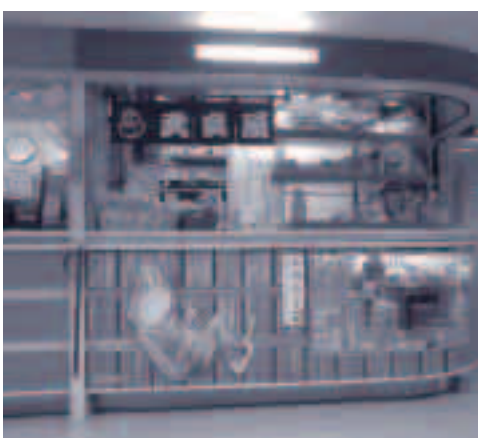
●売店では鬼太郎グッズの販売も

を越えて隠岐まで伸ばし、訪れる人に「美しい自然と悠久の歴史が息づく島」の魅力を知ってほしいと、隠岐青年会議所が企画、境港市観光協会、境港青年会議所、隠岐汽船と協力してその実現に向け取り組んできたものです。原画を作成したのは、「ゲゲゲの鬼太郎」の作者である水木しげる（本名：武良（むら）茂）さんです。祖先が隠岐の島町の出身という縁もあり、快く引き受けてくれたそうです。 1月19日のセレモニーでは、隠岐青年会議所の金田理事長が「地域経済はまだ厳しい状況が続いていますが、鬼太郎フェリーが山陰地方の1つの看板