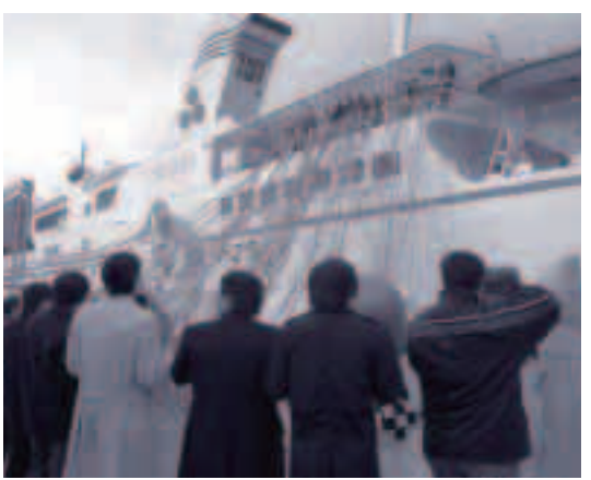
●セレモニーの最後はテープをつないで見送りました

となり、観光客を呼んで景気回復に貢献してくれればと期待しています。「今回は境港と隠岐の共同事業でしたが、これをきっかけに双方が今まで以上に連携を深め、より相乗効果を発揮でき