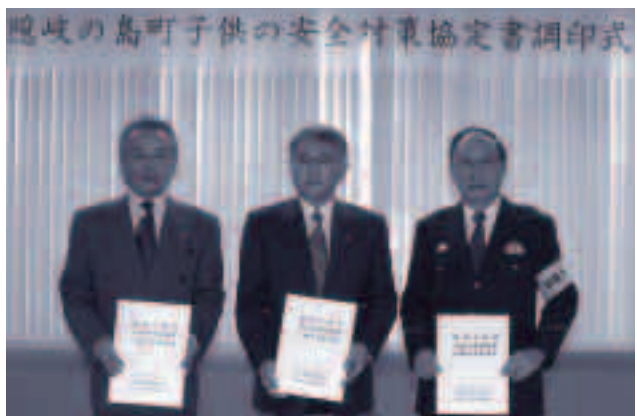
●町、町教委、警察による調印式

昨年、各地で子どもを巻き込んだ犯罪が多く発生しました。中でも年末に起こった広島、栃木県小学校女児殺害事件は全国に大きな衝撃を与えたこととされています。