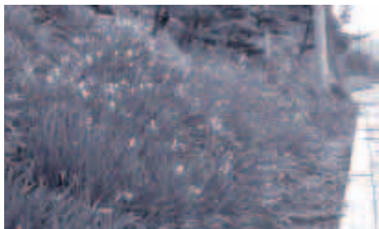
●地区の方々により、横尾トンネルから油井地区までの県道沿いに移植されています。

冬場の花と言えば「水仙」です。今年も、油井地区の水仙が咲き始めました。 昨年は11月に咲き始め、12月には一面白い花に囲まれていましたが、今年も1月中旬でも一分咲きといったところです。 例年1月から3月はじめが見ごろと言われていますから、この広報が発行されるころが、ちょうど見ごろではないでしょうか。