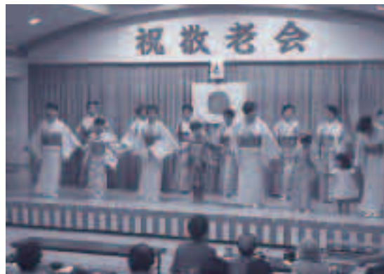
●布施地区敬老会(9/19実施)