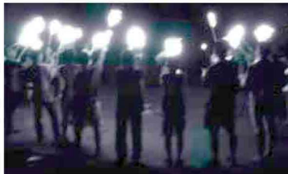
キャンプファイヤー

7月27日(水)から3泊4日の日程で、布施小中学校合同の大満寺教育キャンプが行われました。当初は4泊5日の予定でしたが、台風を警戒し日程を変更して行いました。小中学校合同キャンプは今年で4年目となります。星の観察、火起こし、きもだめし、沢登り、キャンプファイヤー等、4日間様々な体験をしました。体調管理も上手くでき、全員が日程をやり通すことができました。