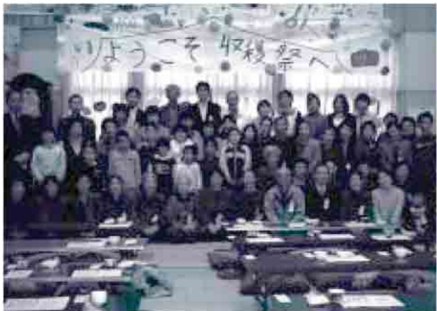
沢山の方に来て頂きました。

私たちの今津小学校は、平成12年に建てられたとても新しい校舎で、全校12名が学習しています。全校12名という少人数なので全校で活動する行事が多いです。特に大きな行事は、11月に行われる収穫祭です。今津小では、一人が一坪ずつ畑をつくっています。12名それぞれが育てたい野菜を決めて、一生けん命育てています。そして、11月になったら野菜やイモなどが収穫できたことに感謝して収穫祭をします。