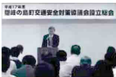
平成17年第39回 隠岐の島町交通安全対策協議会設立総会

去る6月21日(火)に設立総会が開催され、隠岐の島町内における交通事故の撲滅に向け、次の総会宣言が採択されました。 1. 安全運転の励行、飲酒運転、無謀運転、無免許運転、違法駐車等の追放 2. 子供、高齢者、歩行者、自転車利用者等の事故防止 3. シートベルト、チャイルドシート、ヘルメットの着用 4. 運転中の携帯電話の使用禁止