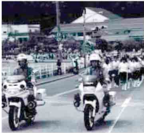
昨年度の交通安全パレード

毎年恒例の島後地区交通安全大会も、今年で36回を数えることとなりました。この間、町民・警察関係者・行政が一体となって交通事故の撲滅に努めてきましたが、残念ながら今なお交通事故の普及や高齢運転者の増加など新たな要因による交通事故も増えていきます。このような状況の中では、誰がいつ交通事故の被害者や加害者になってもおかしくありません。交通安全意識を高め、町民総ぐるみで事故のない明るく住みよいまちをつくりましょう。