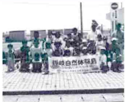
奈良・大阪・兵庫・島根から20名が参加しました。

7月30日(土)から8月4日(木)の5泊6日で、那久小学校を主催場に「隠岐自然体験島」が開催されました。 自然体験や学校宿泊・キャンプによる集団生活、ホームステイを通じた都市部児童との交流を目的に、旧都万村時代から行われており、今年が5回目の開催となりました。 飛行機で来島した生徒は、ホームステイ・宿泊時のまかない・各種体験の講師といった、地元の方々の方々の協力の下、オキサ