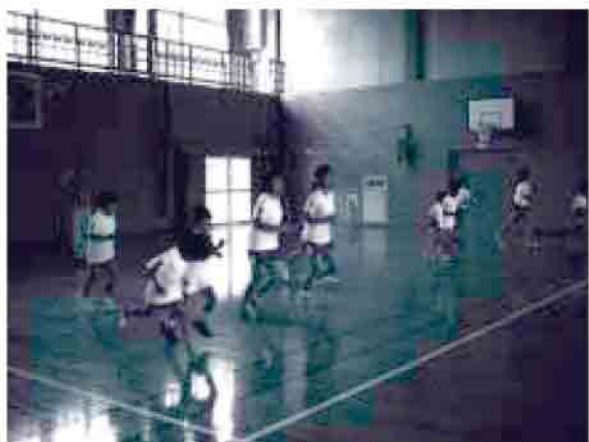
毎日！全校で！走ります！

隠岐にすんでいるときは 隠岐のへいわのなかで ゆめをつくりました。イギリスにかえて、アニメをつくるべんきょうがしたいです。みらいでは たぶん隠岐についてアニメをつくるでしょう！隠岐をでますけど かえて 隠岐についていつも おもいます。またきますよ！さよなら、もういっかいありがとうございました！