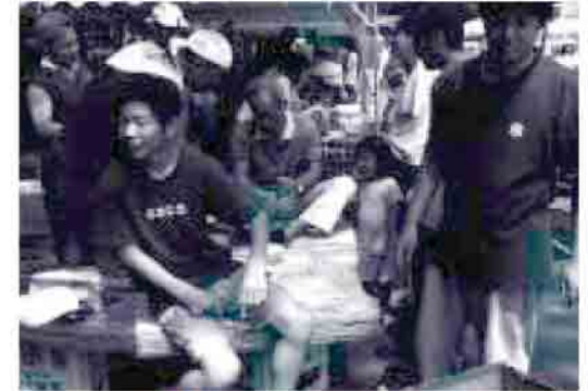
ふるさと体験学習でゲンキ市のお手伝い

7月24日(日)、中村海水浴場で武良フェスタ&ゲンキ市を開催しました。午前10時から始まって夕方8時まで盛りだくさんの催し物で、子供からお年寄りまで武良の夏を満喫しました。 ゲンキ市では、ふるさと体験学習の一環として、小中学生10名が、地域のおじさんやおばさん達と一緒に元気づけ汗を流してくれました。また、今回から市の準備や後片付けに有償ボランティア人材を募集し、地域商店の協力を得て「だんだん券」を試行的に発行しました。