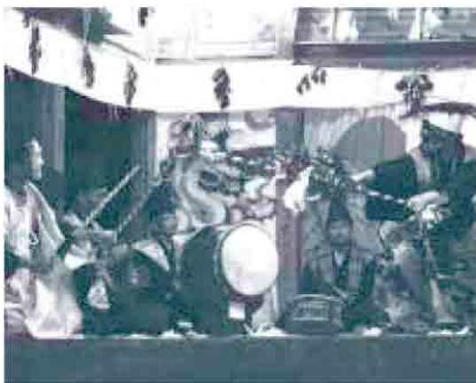
神楽の保存・伝承を通して、地域がひとつになります

久見神楽は明治22年に都万村油井の社家から神楽の技術を習い、現在に受け継いでいるものです。演目が豊富で、勇壮な猿田彦の舞から、巫女舞、ユーモラスな動きの鯛釣りなどがあり、夜通して