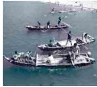
かんこ舟レースは9チームが参加 地元のボレボレ文化村チームが優勝

7月24日(日)、中村海水浴場で武良フェスタ&ゲンキ市を開催しました。午前10時から始まって夕方8時まで盛りだくさんの催し物で、子供からお年寄りまで武良の夏を満喫しました。 ゲンキ市では、ふるさと体験学習の一環として、小中学生10名が、地域のおじさんやおばさん達と一緒に元気づけ汗を流してくれました。また、今回から市の準備や後片付けに有償ボランティア人材を募集し、地域商店の協力を得て「だんだん券」を試行的に発行しました。