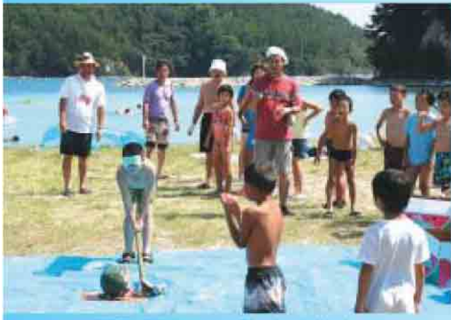
奥津戸、海幸まつりにて「やった！大当たり！」

7月から8月にかけて、町内の海水浴場では相次いでイベントがあり、夏休みの子供達や帰省した方でも盛況でした。 初めに海開きをしたのは、先月号の表紙にもなった布施の春日の浜海水浴場が7月13日。7月17日の福浦海水浴場の海開きでは400人の方が詰めかけ、7月23日には塩浜海水浴場で海開き、7月24日には中村海水浴場で武良フェスタ&ブンキ市(14pに詳細)、最後に8月7日、海幸の浜海水浴場で恒例海幸祭りが開催されました。 今年も暑い日が続いたので、この賑わいは納得。帰る頃には誰もが真っ黒に焼けて帰ったことでしょう。