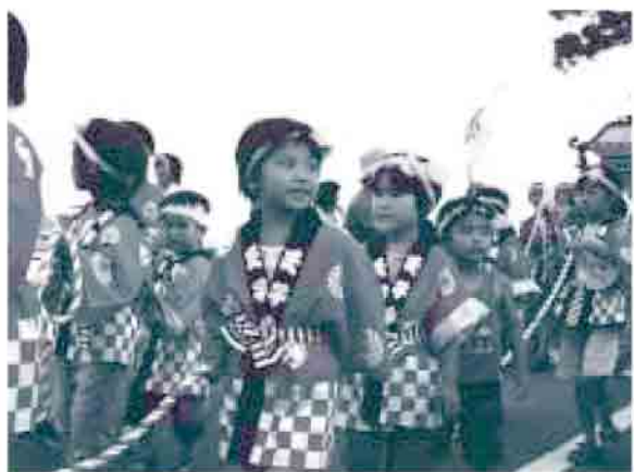
子供も一緒に地区を練り歩きました

きっかけは地域の活性化を目指して始められた「夕べの集い」です。地区の人たちで集まって、カラオケやバーベキューで楽しく過ごし、地区を盛り上げようという企画でした。運営は地区の婦人会や老人会などの団体が中心となり、費用は地区で集めてまかさないました。