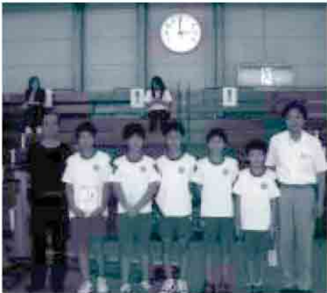
5位入賞した都万小メンバー

7月8日(金) 出雲市「湖遊館」で開催された「第39回交通安全子供自転車島根県大会」に隠岐の島町の代表として