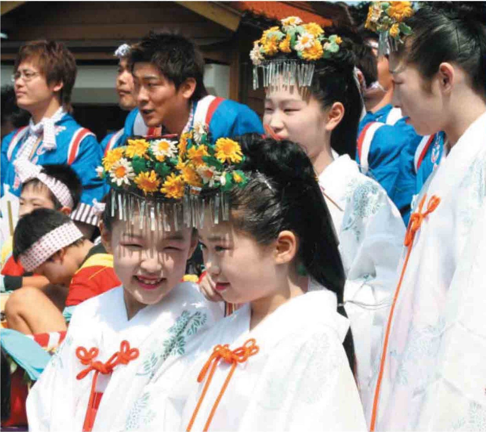
東町 宇屋だんじり舞