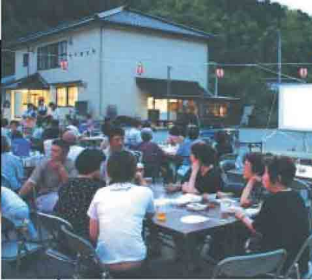
手作りのイベントで、地域を盛り上げます