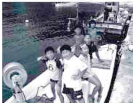
ホームステイ先にて

7月30日(土)から8月4日(木)の5泊6日で、那久小学校を主催場に「隠岐自然体験島」が開催されました。 自然体験や学校宿泊・キャンプによる集団生活、ホームステイを通じた都市部児童との交流を目的に、旧都万村時代から行われており、今年が5回目の開催となりました。 飛行機で来島した生徒は、ホームステイ・宿泊時のまかない・各種体験の講師といった、地元の方々の方々の協力の下、オキサ