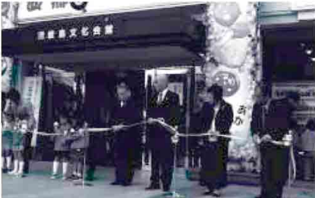
▲昨年の写真から(双葉保育園と下西保育所の園児によるテープカット)

◎出品する作品は、自作のものでなるべく未発表のものであること。 ◎生物、液体など展示に不相当と思われるものや、極端に壊れやすいものは西郷公民館にご相談ください。