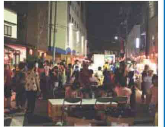
たくさんの人出でにぎわいました

8月4日(金)、5日(土)の夜、西郷ピア前道路を中心に恒例の夏祭りが行われました。 両日とも大変な人出で、子供達は道路の両脇にびっしり並んだ夜店やお化け屋敷などを往復し、大人はステイジで行われた歌謡ショーなどのイベントや、路上に設置されたテーブルでビールを飲みながら祭りの雰囲気を楽しんでいました。 また、隠岐ならではの真鯛の一本釣りコーナーでは、大物を吊り上げると一際大きな歓声があがっていました。これらの企画、炎天下、汗だくになって準備を進めた実行委員や関係者の皆さんの「たくさんの人に来てもらい喜んで帰ってほしい」との心意気があってのものだと感じました。