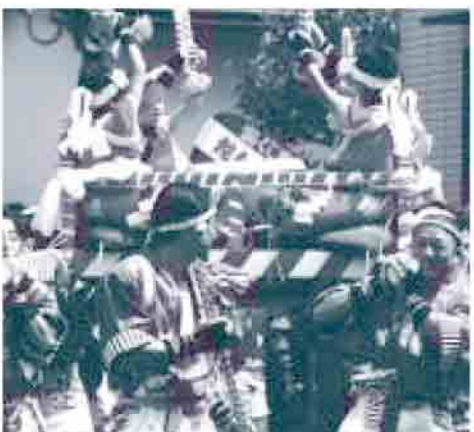
3年に1度の祭りを、地域一丸となって盛り上げます