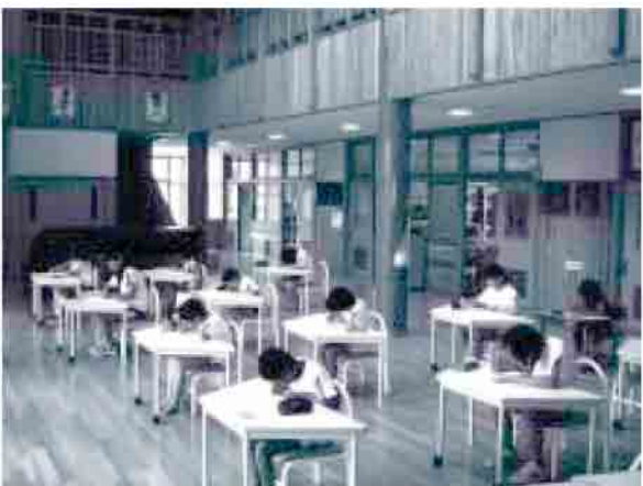
「漢字・計算大会」・・・真剣です。

この時には、保護者や地域の人をまねておもちやそばやスイートポテトをふるまいます。各学年の出し物もして、来られた方々を楽しませるようにしています。