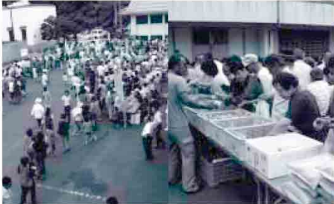
新鮮な産物を求めて、多くの方が会場に詰めかけました。

7月29日(金)に隠岐島文化会館駐車場で、隠岐の島町新鮮市を開催しました。当日は、地元で取れた新鮮な野菜・魚貝類をはじめ、農林産加工品、水産加工品の販売を行い、たくさんの方でにぎわいました。今後も季節毎に地元で取れた旬の新鮮野菜、魚貝類を販売したいと思えます。次の開催は秋を予定しています。なお、隠岐新鮮市では、会員の募集を行なっています。詳しくは隠岐新鮮市事務局(JA隠岐)までお問い合わせください。