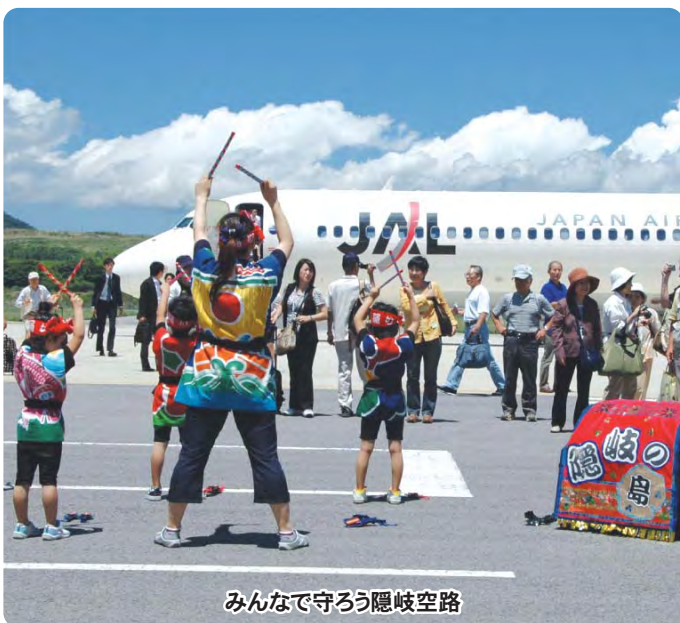
みんなで守ろう隠岐空路

◇隠岐空港利用促進に 260万円 隠岐空港利用促進のため、大阪、出雲便特別対策として追加する。