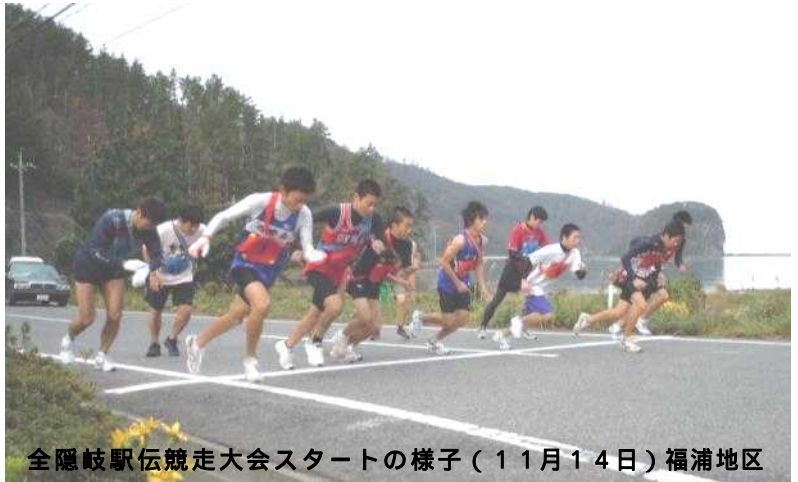
全隠岐駅伝競走大会スタートの様子(11月14日)福浦地区

第99号(2010年11月18日発行) 毎月第1・第3木曜日発行 発行：隠岐の島町役場総務課広報広聴係